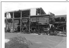
石巻の水産加工工場も壊滅 的な打撃。

ある代理店さんが言ってました。「私は、お客さんと喧嘩してでも地震 保険をススメます」と。