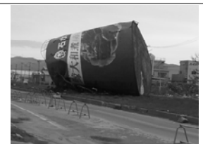
石巻市の缶詰工場の看板が 道路の真ん中に!

石巻、女川、宮古の被災地に行ってきました。復興には程遠い状況で す。商店街はほとんどがシャッターが閉まっている中で、懸命に復興に 向けて前に進もうとしているお店も中にはあります。その復興への原動 力は、「経済力」すなわち「お金」なんですね。