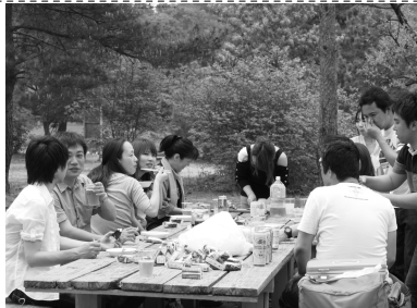
みんなでワイワイおしゃべりしながらの食事はおいしい!

天候にも恵まれ、気持ちのいい青空の下 みんなでワイワイガヤガヤ おしゃべりにも花が咲き お腹いっぱい食べました。 食後は腹ごなしにキャッチボールや古坪のウクレレを囲んでの合唱(?) (キャンプファイ-か!?(^_^))